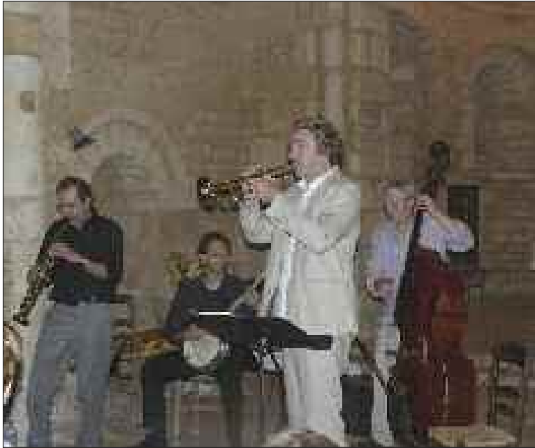
Le Pocket Orchestra