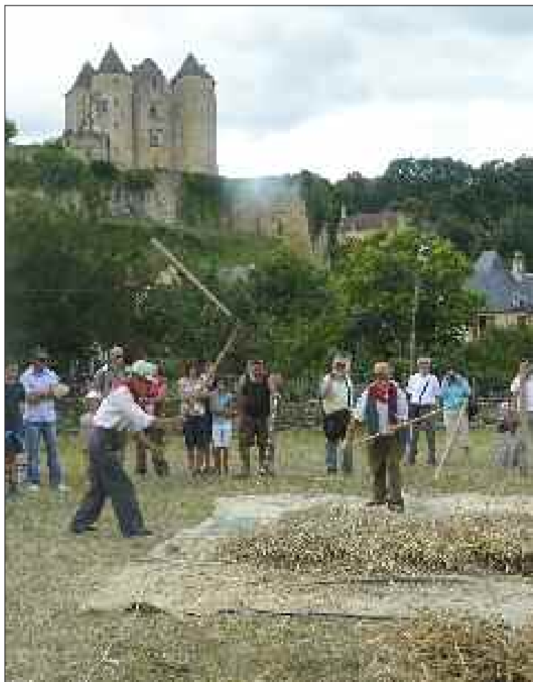
Battage au fléau au pied du château