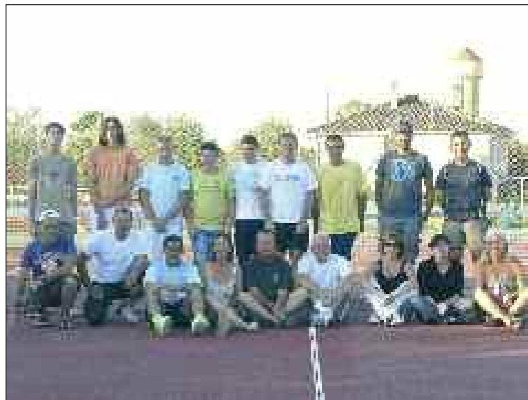
Une partie des compétiteurs