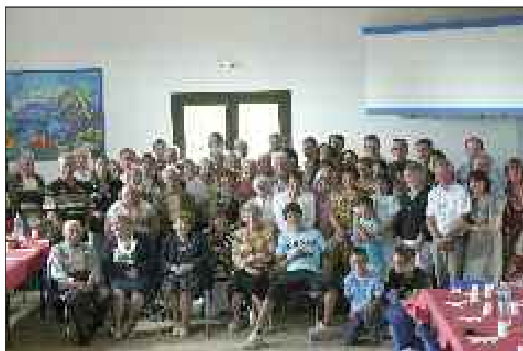
La cousinade, une occasion de faire ou refaire connaissance