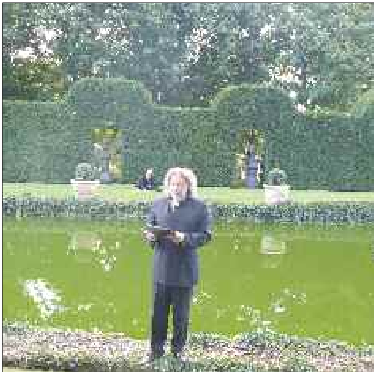
Le voyage raconté par Alain Carré