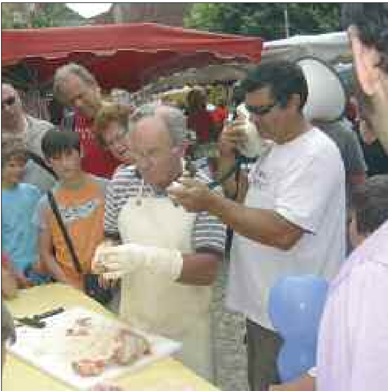
Découpe d'un canard

Franc succès de l'annuel Salon de la gastronomie qui s'est déroulé le 1 er août sur la place principale et dans les ruelles de Daglan, où les exposants se sont réunis autour du thème de la gastronomie. Le temps était propice à la balade, et les