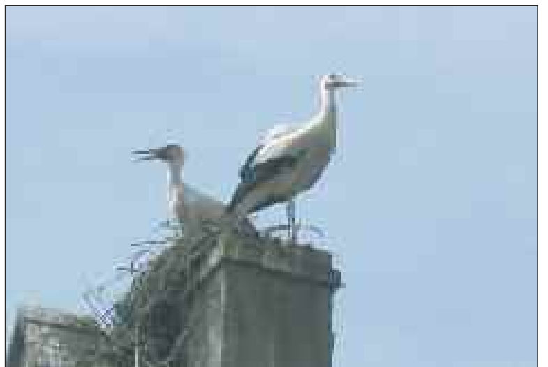
A Sélestat en juin 2010