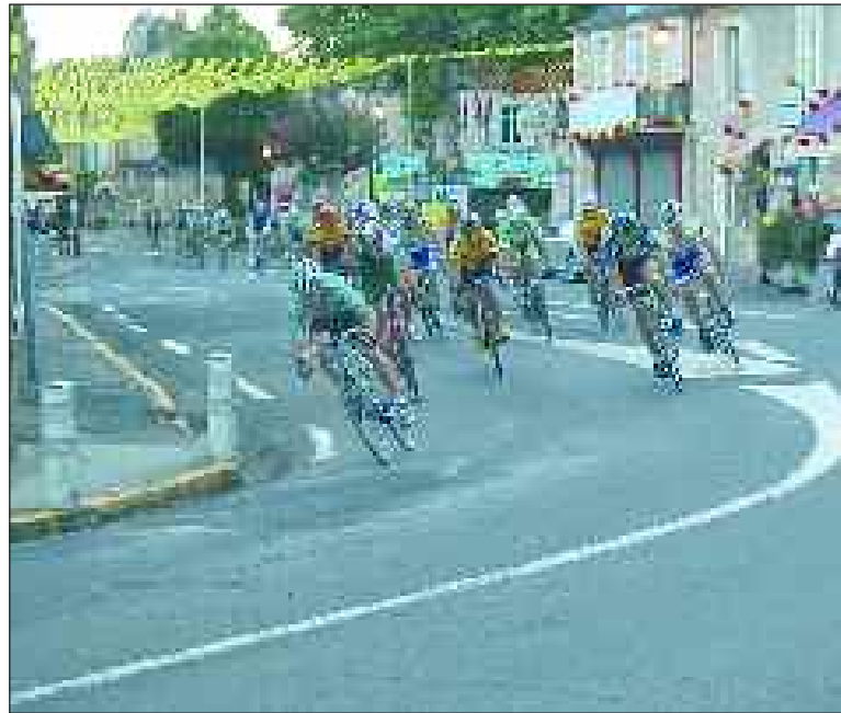
La traversée de la ville